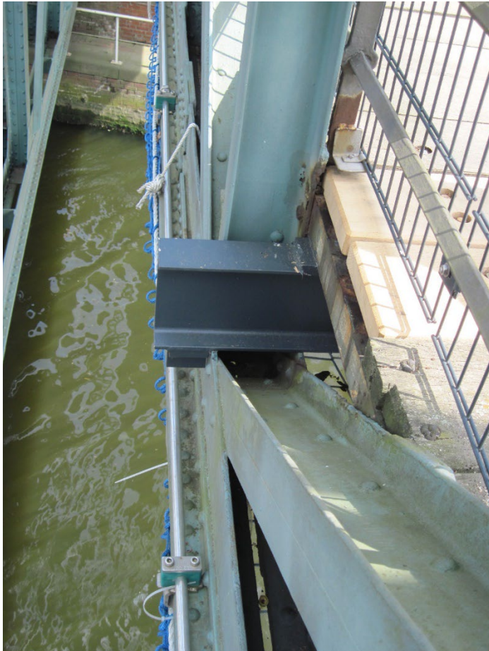
Montage Stahlträger Fußgängerbrücke Mai 2022

Wasserstraßen- und Schiffahrtsverwaltung des Bundes