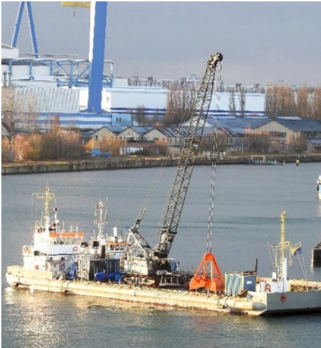
Seilzugbagger auf der „Steinbutt“