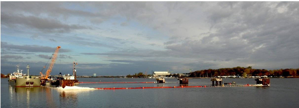
Schute an der Schlickgrube mit Schlickvorhang