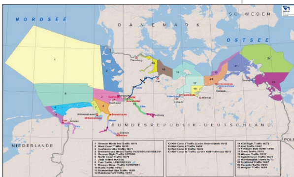
Verkehrskanäle der Verkehrszentralen im Küstenbereich