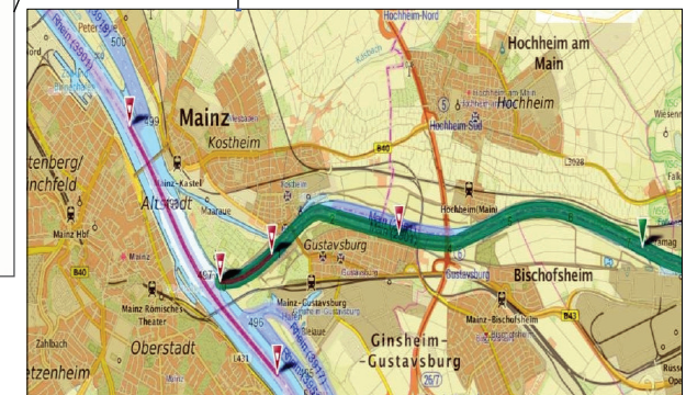
Kartenbasierte Darstellung von ELWIS-Informationen

Besuchen Sie uns im Internet: www.elwis.de